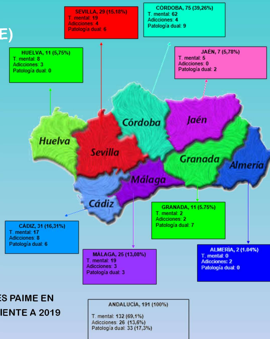
ESTADÍSTICA DE PACIENTES PAIME EN ANDALUCÍA CORRESPONDIENTE A 2019

LA ASISTENCIA DE OTRAS PATOLOGÍAS MENTALES QUEDAN FUERA DE ESTE CONVENIO.