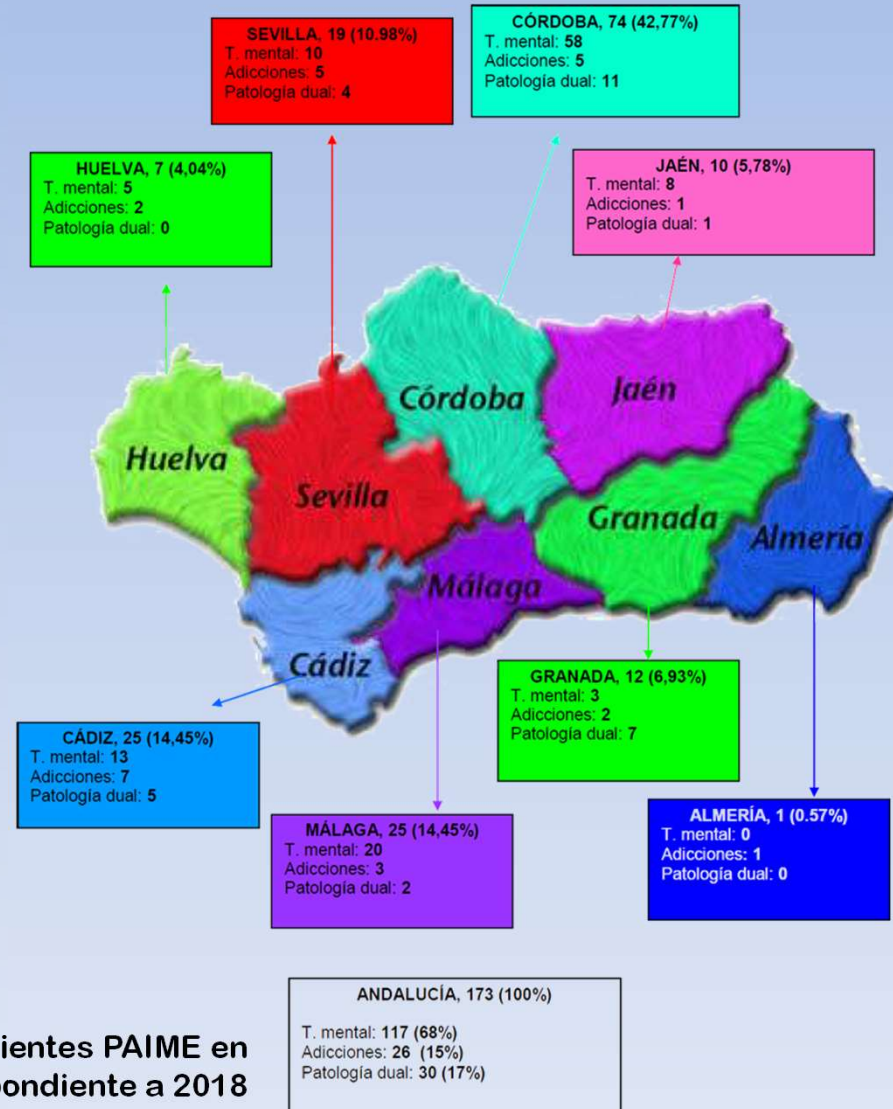
Estadística de pacientes PAIME en Andalucía correspondiente a 2018

La asistencia de otras patologías mentales quedan fuera de este convenio.