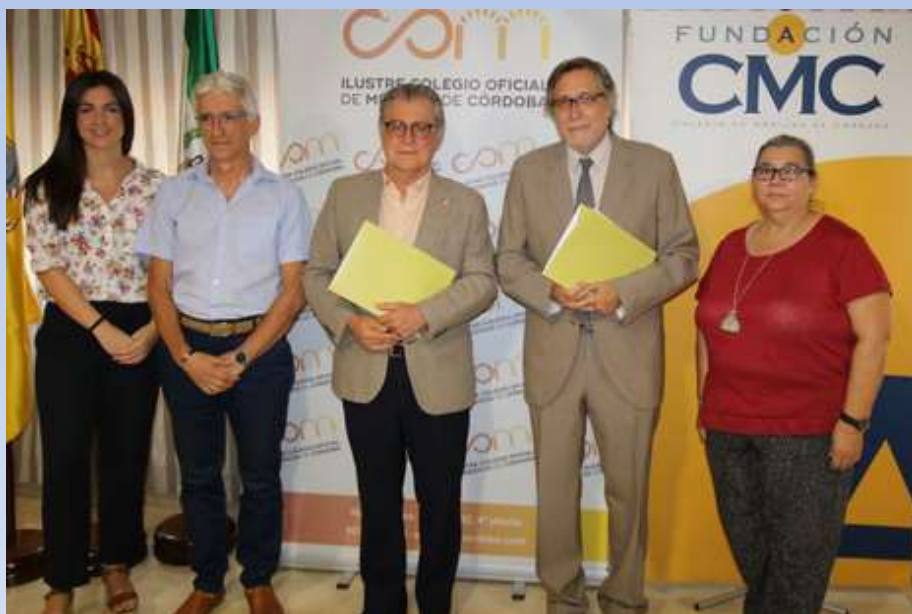
Firma del convenio (agosto 2018)