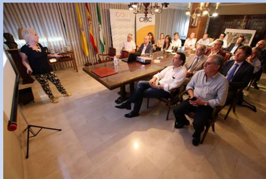
Sesión informativa (octubre 2018)